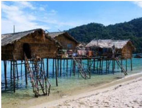
ภาพการปลูกบ้านริมชายหาดของมอแกนในอดีต

มอแกนได้รับการสนับสนุนวัสดุก่อสร้างและเครื่องใช้จำเป็นภายในบ้านรวมทั้งข้าวสารอาหารแห้ง และมีอาสาสมัครเข้ามาช่วยสร้างบ้านให้ที่อ่าวบอนใหญ่ (แนอ๊ะ อ่าต๊ะ) หมู่บ้านใหม่มีลักษณะต่างจากเดิม บ้านที่สร้างเรียงกันเป็นแถวขนานกันทำให้บ้านที่อยู่ด้านหลังค่อนข้างจะอับลมและคนในบ้านไม่สามารถจะมองออกมาเห็นทะเล หรือสังเกตเรือที่เข้ามาได้ นอกจากนั้นบ้านก็มีลักษณะเหมือนกันและมีขนาดเดียวกัน