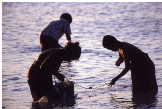
วิถีชีวิตของมอแกนที่ผูกพันและหากินกับทะเล