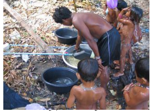
บริเวณจุดจ่ายน้ำที่มอแกนจะมาใช้น้ำร่วมกัน

ปัจจุบันมีการต่อน้ำประปาจากแหล่งน้ำและจ่ายน้ำเป็นจุดใหญ่ๆ เพื่อมอแกนได้ใช้น้ำร่วมกัน นอกจากนั้นยังมีการสร้างห้องน้ำ 9 ห้องและห้องส้วม 9 ห้องเพื่อให้มอแกนได้ใช้ แต่เดิมมอแกนถ่ายบริเวณชายหาด เมื่อมีห้องส้วม มอแกนรุ่นใหม่ๆ หันมาใช้ห้องส้วมกันบ้าง ปัจจุบันห้องส้วมเต็มและใช้การไม่ได้ตั้งแต่ต้นปี 2549