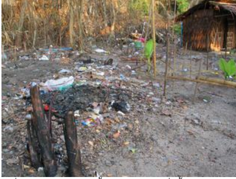
เมื่อหมู่บ้านมีขนาดใหญ่ขึ้น ปริมาณขยะก็เพิ่มขึ้นตามไปด้วย