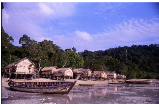
ในอดีต นอกจากอ่าวบอนแล้ว มอแกนยังตั้งบ้านเรือนอยู่ที่อ่าวไทรเอน