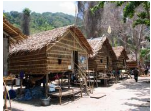
สภาพบ้านใหม่ที่สร้างเรียงกันเป็นแถวขนานกันด้านในชายหาด

หมู่บ้านที่มีขนาดใหญ่และประกอบไปด้วยประชากรจำนวนมากเช่นนี้ (ประมาณ 60 หลังคาเรือน) อาจจะทำให้เกิดผลกระทบในระยะยาวในหลายด้าน อาทิเช่น ด้านสิ่งแวดล้อมและสุขอนามัย เนื่องจากมีความแออัดมากขึ้น มีขยะ ของเสีย น้ำทิ้งที่มีปริมาณมากขึ้น จึงอาจจะมีผลกระทบต่อสิ่งแวดล้อมและสุขอนามัยของมอแกน ด้านทรัพยากรธรรมชาติ มอแกนมักจะหาอาหารบริเวณชายฝั่งที่ใกล้กับหมู่บ้าน เมื่อประชากรกระจุกตัวอยู่บริเวณเดียว การใช้ทรัพยากรก็จะเข้มข้นแน่นหนากอยู่ในบริเวณเดียว และก่อให้เกิดความเสื่อมโทรมของทรัพยากรและสิ่งแวดล้อมได้ในอนาคต ด้านสังคม ในอดีต การกระจายตัวของประชากรและความยืดหยุ่นของการโยกย้ายชุมชนเป็นกลไกทางสังคมที่ทำให้มอแกนสามารถจัดการกับความขัดแย้งในชุมชนได้ แต่ปัจจุบันเมื่อมีการรวมตัวกันเป็นชุมชนใหญ่ ความขัดแย้งก็มีแนวโน้มที่จะเกิดได้ง่ายขึ้น ในขณะที่เดียวกัน การอพยพโยกย้ายออกนอกชุมชนที่เคยเป็นกลไกที่จะช่วยบรรเทาความขัดแย้งและความบาดหมางในชุมชนก็ถูกจำกัดลง